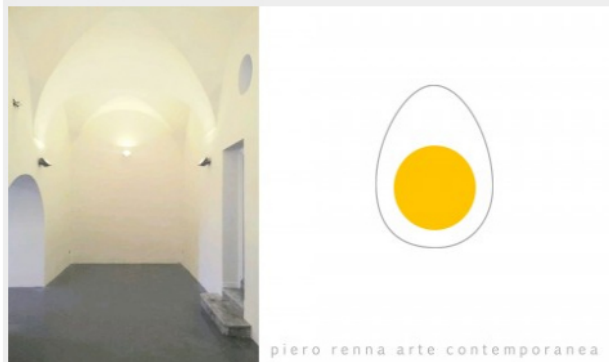
piero renna arte contemporanea